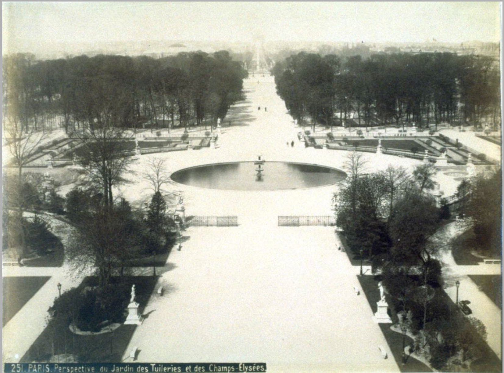
251. PARIS. Perspective du Jardin des Tuileries et des Champs-Élysées.