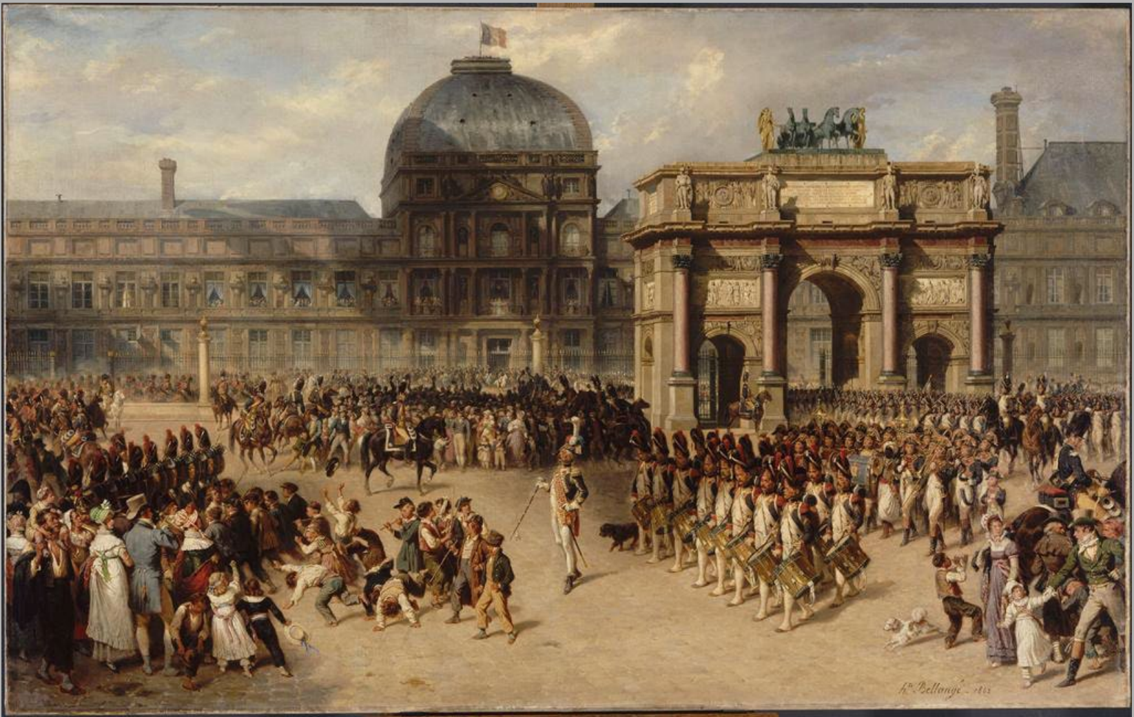
Hippolyte Bellangé and Adrien Dauzats, A Day of Review under the Empire in 1810 ( Un jour de revue sous l'Empire ), 1862. Oil on canvas, 105 × 160.5 cm. Musée du Louvre, Paris.