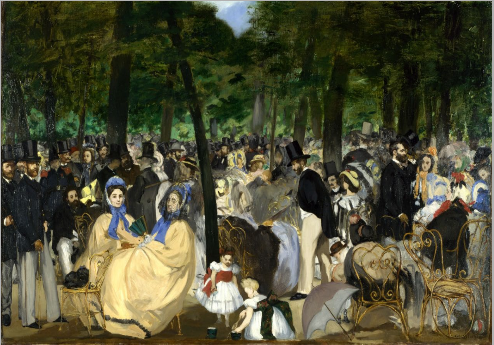
Edouard Manet, Music in the Tuileries , 1862. Oil on canvas, 76.2 × 118.1 cm. National Gallery, London.